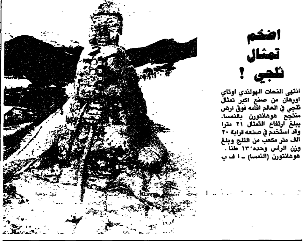
انتهى النحات الهولندي اوتاي اورهان من صنع اكبر تمثال تلجي في العالم اقامه فوق ارض منجم هومانتون بالنمسا. يبلغ ارتفاع التمثال ٢١ متراً وقد استخدم في صنعه قرابة ٢٠ الف متر مكعب من التلج وبلغ وزن الراس وحده ١٣ طناً. هومانتون (النمسا)